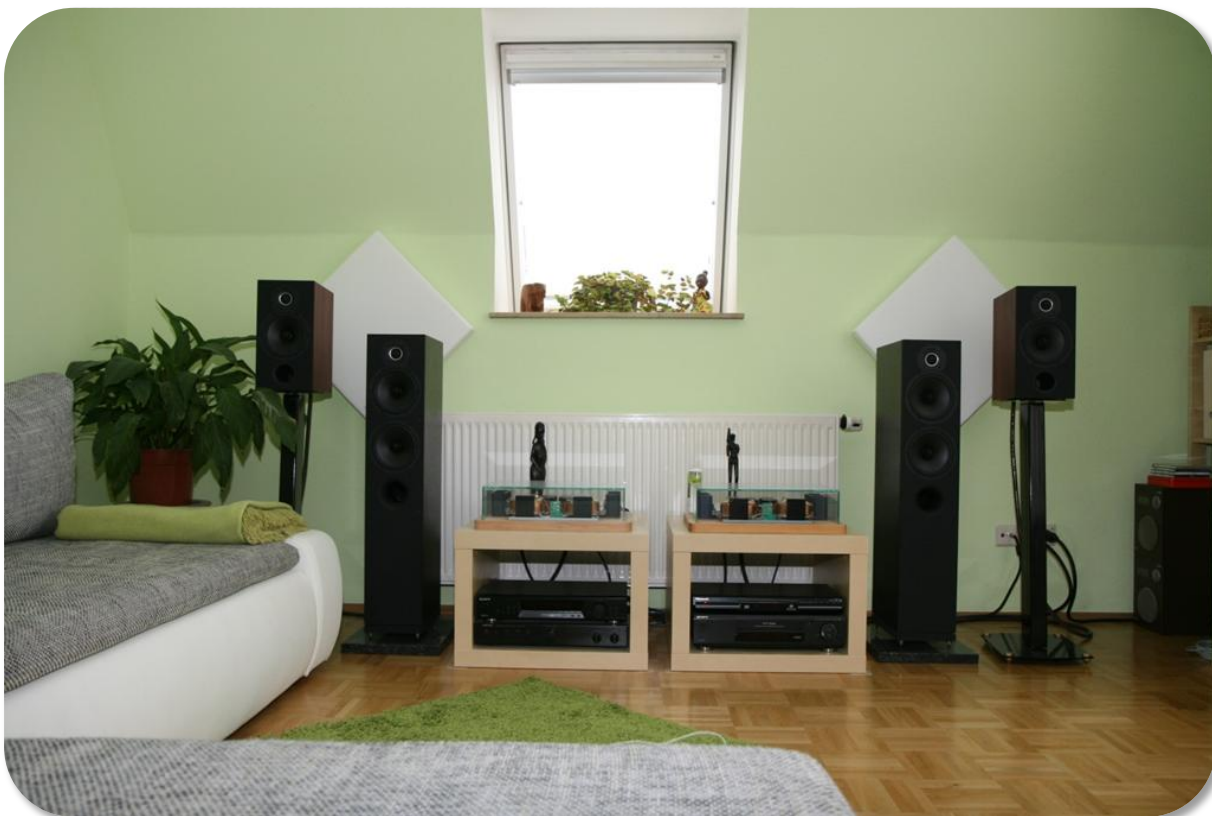
Tesi 560 mit ihrer kleinen Schwester Tesi 260